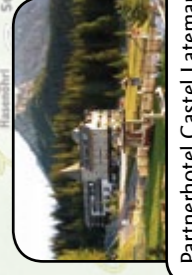
Partnerhotel Castel Latemar (Karersee - Dolomiten) www.castellatemar.it